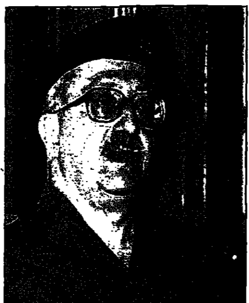
مطار عزيمت يتحدث الى الصحفيين في بغداد أمس (ديتار)